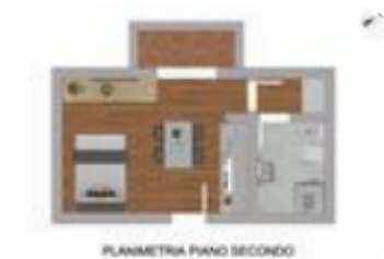
PLANIMETRIA PIANO SECONDO