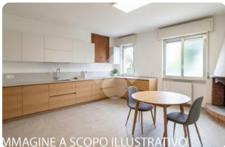
IMMAGINE A SCOPO ILLUSTRATIVO