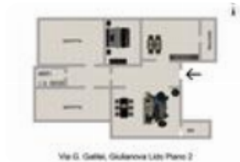
Via G. Galilei, Giulianova Lido Piano 2