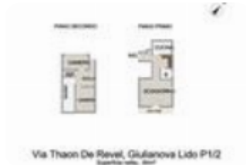
Via Thaon De Revel, Giulianova Lido P1/2 Superficie: 84 mq