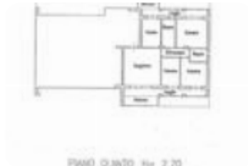
PIANO QUINTO - Nr. 2.70

Questo immobile è esente da classe energetica