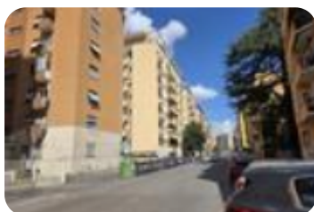
FOTO IN FASE DI REALIZZAZIONE