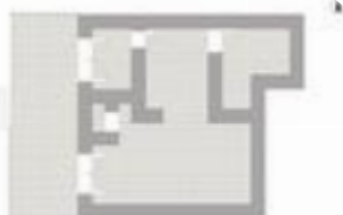
Via Vasca Cozzolino

CESSIONE ATTIVITÀ – PIZZERIA AVVIATA A POLLENA TROCCHIA Pollena Trocchia, precisamente in Via Vasca Cozzolino, Tecnocasa per le imprese propone la cessione di attività di pizzeria ben avviata, pronta all'uso e completa di tutte le attrezzature e arredi. Prezzo cessione: € 48.000 Canone di locazione: € 1.350 mensili L'immobile ha una superficie complessiva di circa 120 mq ed è così composto:- Sala esterna di circa 30 mq - Sala interna accogliente e ben organizzata- Cucina- Sala forni con forni a gas- Bagno personale- Antibagno con doppi servizi (uomini e donne) L'attività viene ceduta completamente arredata e attrezzata, permettendo un immediato inizio dell'attività senza ulteriori investimenti. Zona ben servita e con buona visibilità Ideale per chi desidera avviare o ampliare un'attività nel settore della ristorazione Per appuntamenti, contattare AGENZIA TECNOCASA IMPRESA in Via Manzoni N°178 San Giorgio a Cremano - Telefono fisso e WhatsApp 081.3996019 Offriamo valutazioni gratuite e consulenza mutuo per rendere sempre più sereno e tranquillo l'acquisto del vostro nuovo locale commerciale. Seguici sulle nostre pagine Facebook e Instagram per essere sempre ag [...]