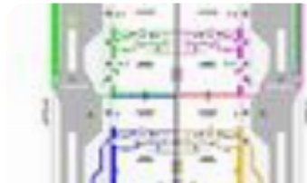
PIANA PIANO SECONDO (SOTTOTETTO)