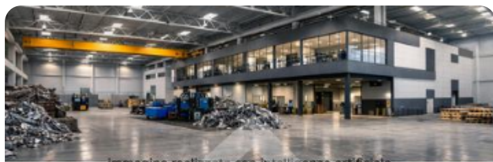
immagine realizzata con intelligenza artificiale