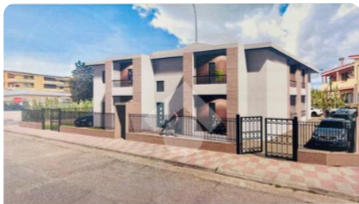
REALIZZAZIONE DI UN FABBRICATO DA ADIBIRE A CIVILE ABITAZIONE