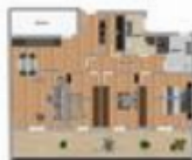
VIA SABAUDIA 64