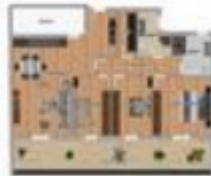
VIA SABAUDIA 64