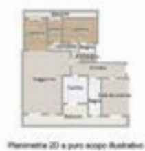
Planimetria 2D a puro scopo illustrativo