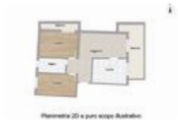
Planimetria 2D a puro scopo illustrativo