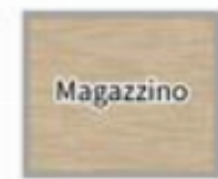
Planimetria 2D a puro scopo illustrativo