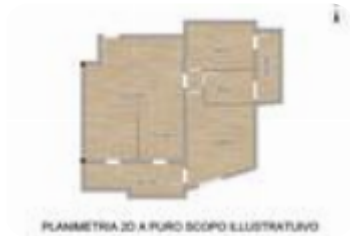
PLANIMETRIA 2D A PURO SCOPO ILLUSTRATIVO