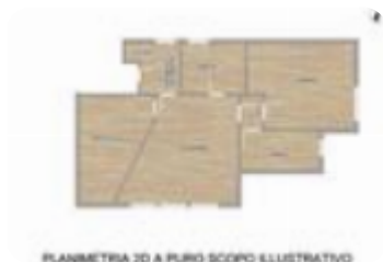
PLANIMETRIA 3D A FINO SCOPO ILLUSTRATIVO