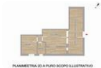
PLANIMETRIA 2D A FINO SCOPO ILLUSTRATIVO