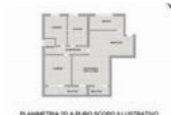
PLANIMETRIA 2D A PURO SCOPO ILLUSTRATIVO

San Francesco – 4 locali ristrutturato con balconi, garage e cantina. Contattaci per maggiori informazioni! Proponiamo in vendita un appartamento di 90 mq, posto al primo piano di un fabbricato edificato nel 1987, oggetto di interventi di ristrutturazione post-sisma che hanno interessato infissi in PVC con doppio vetro, pavimentazione e rifacimento completo degli impianti. L'ingresso introduce direttamente nella zona giorno, composta da un soggiorno con cucina a vista, completamente rinnovata nel 2019, ambiente funzionale e ben illuminato grazie all'accesso al primo balcone. La distribuzione interna, razionale e ben organizzata, prevede un disimpegno che conduce alla zona notte, composta da tre camere da letto, di cui una con balcone privato, e doppi servizi entrambi finestrati, uno dotato di vasca e l'altro di doccia. Completano la proprietà un garage e una cantina, tra loro comunicanti, che offrono pratici spazi accessori ideali sia come deposito